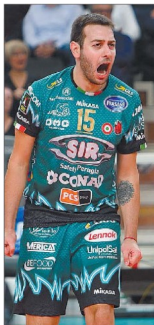
Regista Il palleggiatore argentino ha distribuito palloni con grande precisione

PROSSIMO TURNO Domenica 8 dicembre ore 18. Cucine Lube Civitanova-Sir Safety Conad Perugia 3-1 disputata il 10 novembre. Leo Shoes Modena-Calzedonia Verona ore 15, Allianz Milano-Gas Sales Piacenza, Vero Volley Monza-Globo Banca Popolare del Frusinate Sora anticipo di sabato 7 alle ore 20.30, Consar Ravenna-Kioene Padova, Top Volley Latina-Tonno Callipo Calabria Vibo Valentia. Riposa: Itas Trentino.