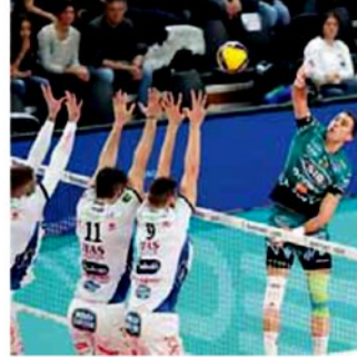
• Il muro dell'Itas