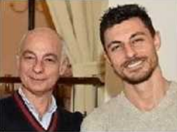
Via degli Orti 19, Trento