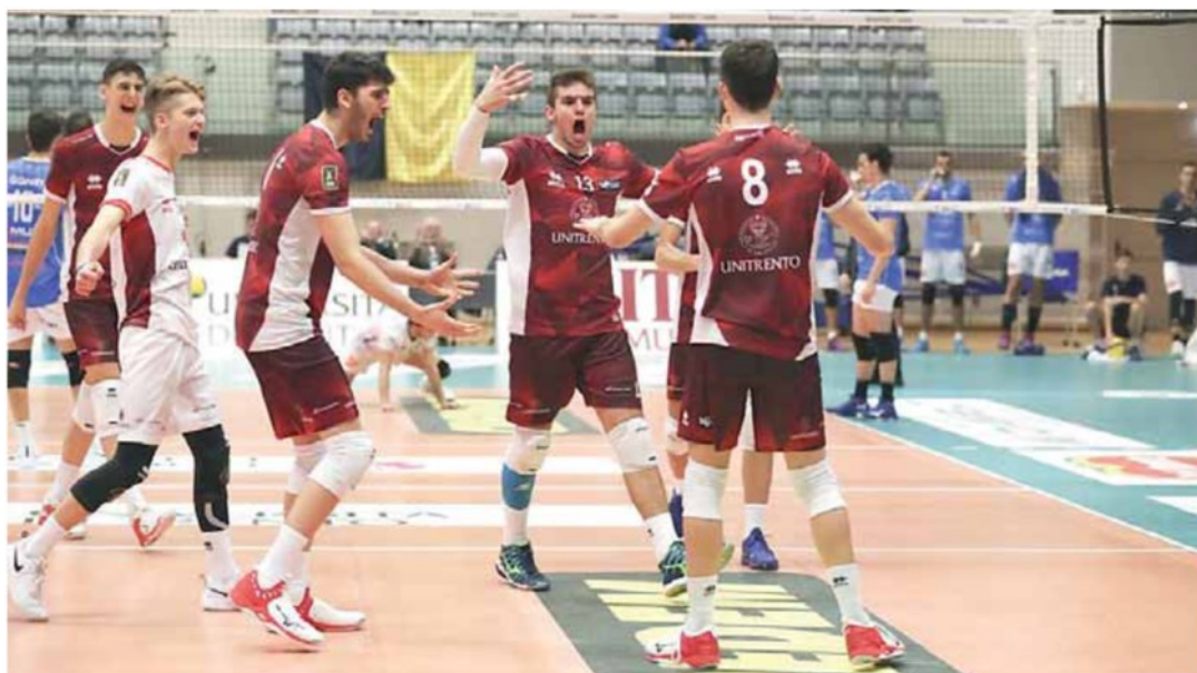
• L'UniTrento festeggia: dopo due sconfitte è tornata a vincere

Cuneo volley - Hrk motta di Livenza Tv, Tinet gori wines pn - Gamma chim.brugherio mb, Tippiesse Cisano bg - Goldenplast Civitan.mc, Gibam Fano pu - Unitrento volley, Mosca Bruno Bolzano - Bisc.marini P.viro Ro, Invent vtc San Dona'Ve - Vivabanca Torino