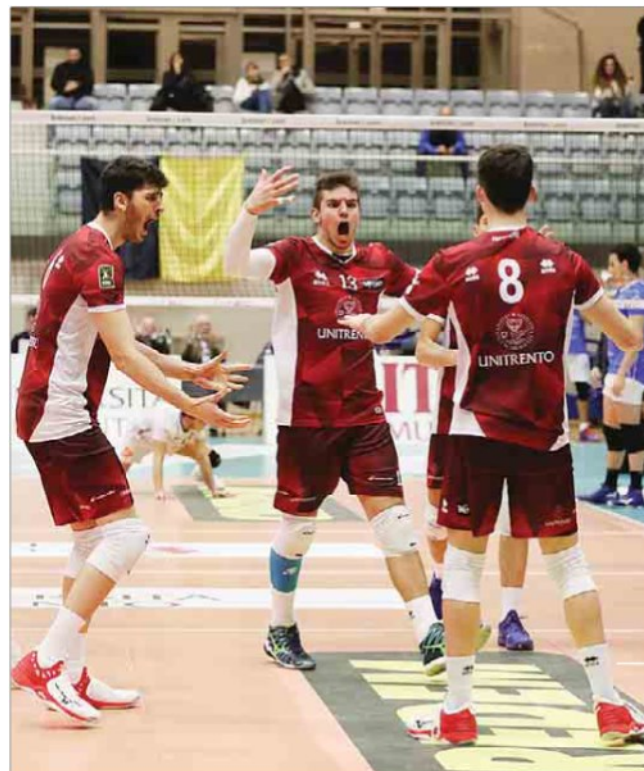
Contro Civitanova una vittoria che ha ridato morale all'UniTrento dopo due sconfitte consecutive

NOTE: UniTrento: 9 muri, 5 ace, 14 errori in battuta, 14 errori azione, 43% in attacco, 61% (42%) in ricezione. Civitanova: 13 muri, 4 ace, 20 errori in battuta, 9 errori azione, 47% in attacco, 69% (45%) in ricezione